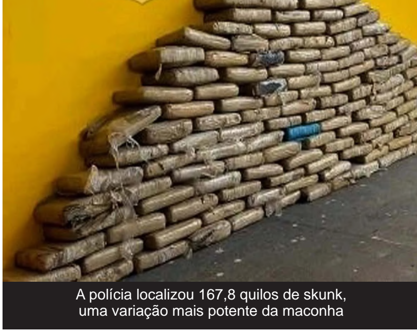
A polícia localizou 167,8 quilos de skunk, uma variação mais potente da maconha

(Da Redação) Uma ação da Polícia Rodoviária Federal (PRF) realizada, na terça-feira (24), resultou na prisão em flagrante de um motorista, de aproximadamente 35 anos, por tráfico de drogas na BR-174, em Vilhena. De acordo com as informações, os agentes da PRF realizavam fiscalização de rotina quando abordaram um veículo. Durante a inspeção, eles localizaram 167,8 quilos de skunk, uma variação mais potente da maconha. Diante do flagrante, o motorista foi preso em flagrante. Após a prisão, o suspeito, que não