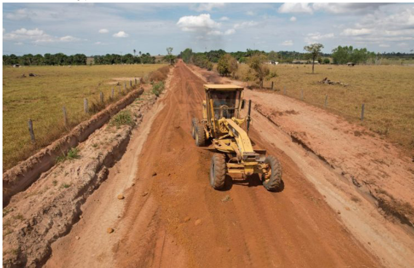
Equipes da Secretaria Municipal de Obras estão atuando de forma contínua

(Da Redação) A Prefeitura de São Francisco do Guaporé está aproveitando o período de estiagem para intensificar os trabalhos de recuperação das estradas vicinais da zona rural do município. As equipes da Secretaria Municipal de Obras têm atuado de forma contínua, para melhorar as condições de trafegabilidade e garantir o escoamento da produção agrícola.