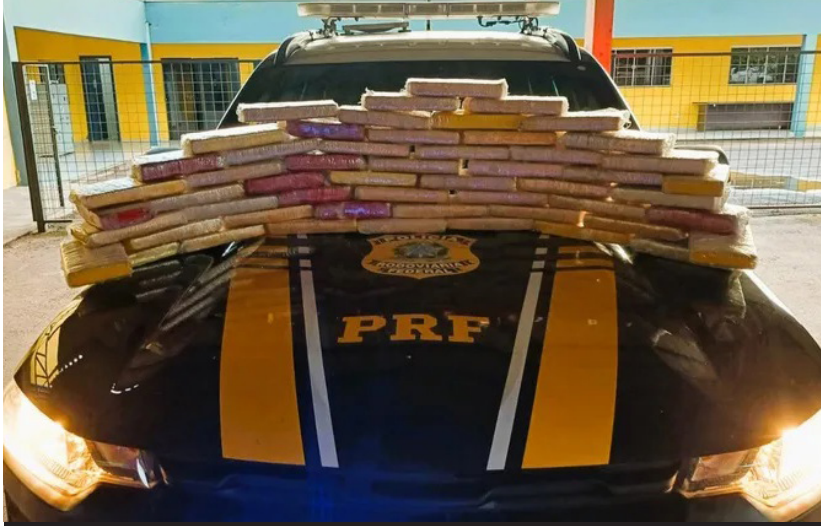
A droga, que saiu do Acre com destino a Brasília e Goiânia, foi interceptada em Ji-Paraná

(Da Redação) A Polícia Rodoviária Federal (PRF), em Rondônia, apreendeu, no domingo (12), 56,9 kg de cloridrato de cocaína. O flagrante ocorreu, às 15 horas, no km 352 da BR-364, em Ji-Paraná.