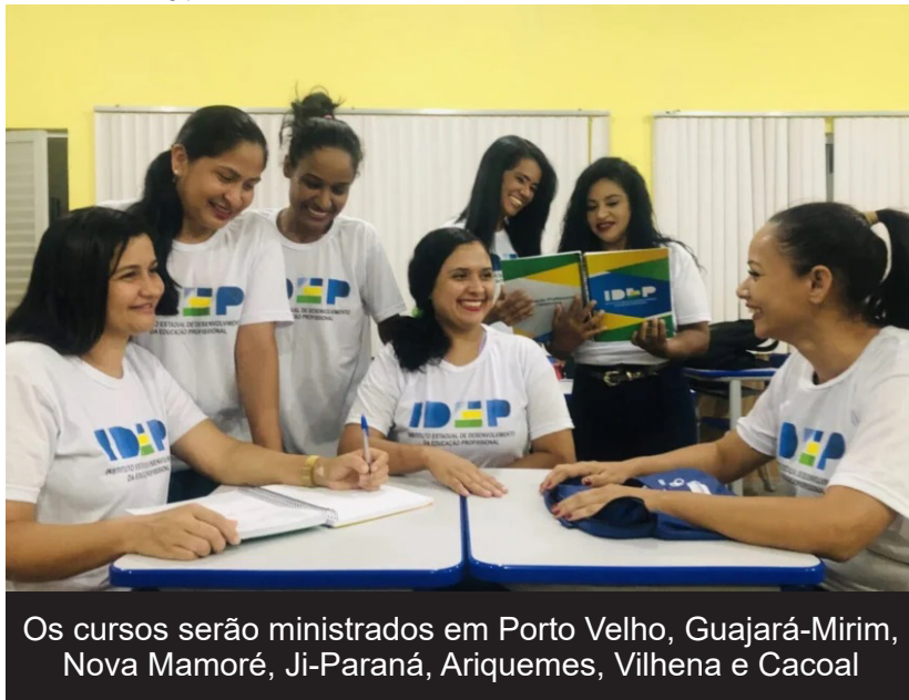
Os cursos serão ministrados em Porto Velho, Guajará-Mirim, Nova Mamoré, Ji-Paraná, Ariquemes, Vilhena e Cacoal

(Da Redação) Mais um processo seletivo para quem tem interesse em lecionar no ensino profissionalizante acaba de ser lançado em Rondônia. O Instituto Estadual de Desenvolvimento da Educação Profissional de Rondônia (Idep) abriu, hoje (11), as inscrições para processo seletivo de bolsistas – instrutores do Programa Nacional de Acesso ao Ensino Técnico e Emprego (Pronatec) – para atuar no Programa Mulheres Mil, cujo objetivo é oferecer qualificação profissional e elevação da escolaridade para mulheres em situação de vulnerabilidade social e econômica. As inscrições serão presenciais e seguem até a sexta-feira (12). Todas as informações do certame estão disponíveis no link https://rondonia.ro.gov.br/wp-content/uploads/2026/06/Edital_1-Pronatec.pdf Os municípios contemplados são: Porto Velho (distritos de Calama e Extre-