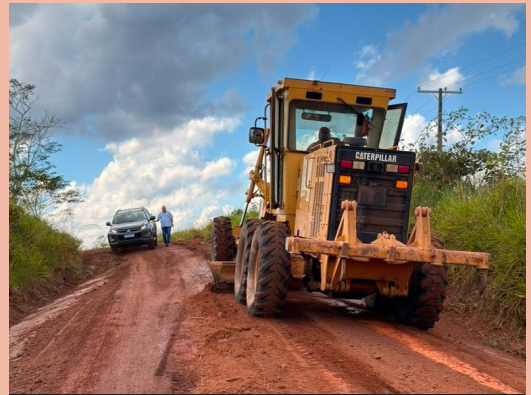
Os trabalhos de recuperação ocorrem nas regiões das linhas 15, 17, 14 e 13, além dos travessões Suruí