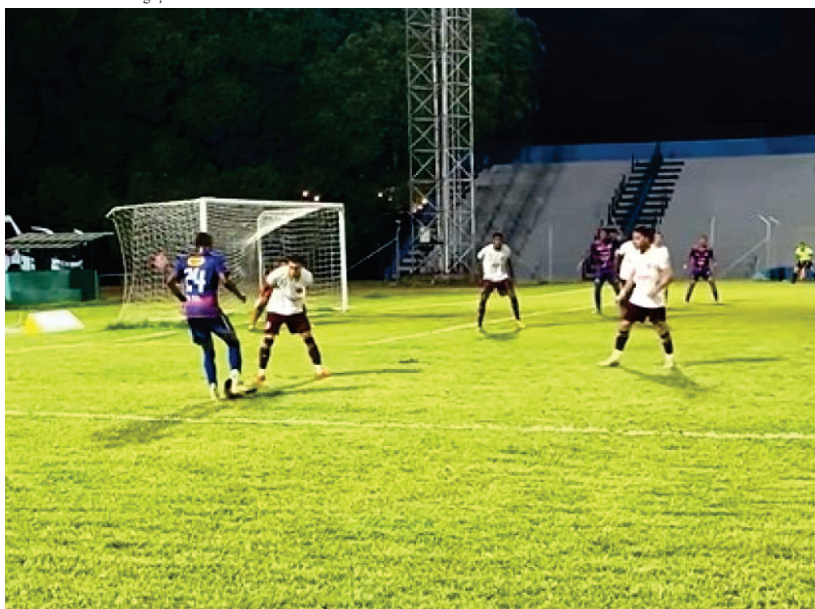
Equipe vilhenense sofreu 24 gols e marcou apenas um no Campeonato Rondoniense

pontuação do Sport Genus, mas com um jogo a menos e uma vitória a mais. Para o Vilhena, o Rondoniense Sicredi 2025 marca o pior desempenho do